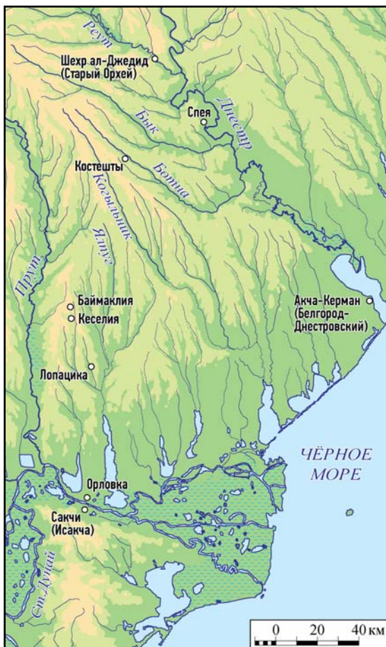
Рис. 2. Топография находок средневековых сербских монет в Пруто-Днестровском регионе.