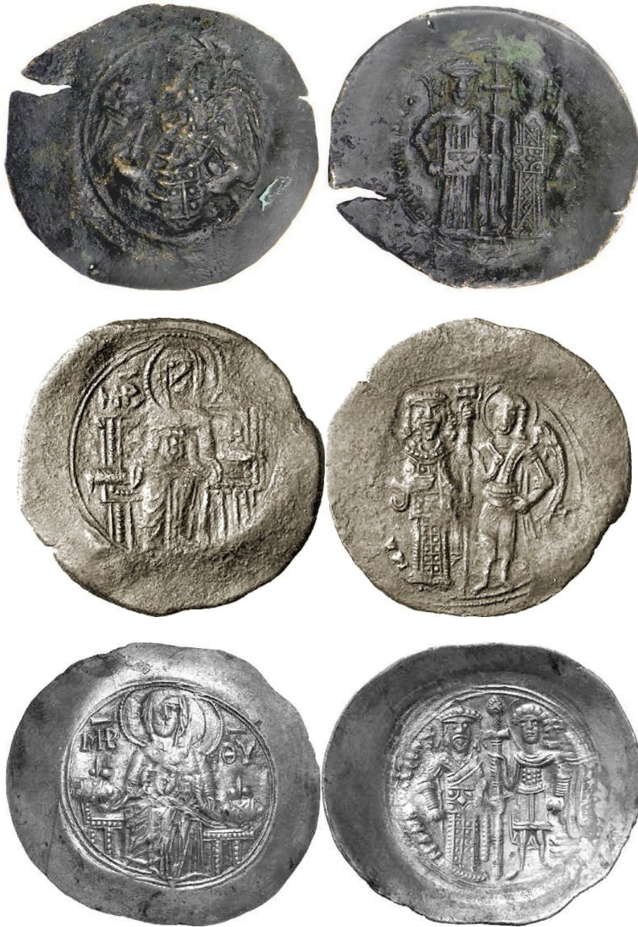
1. Njegov teča Manuel Komnenos Doukas (1230-1237).

Vrsta 2. 5 bakrenih “Marija majka Isusa blagosilja kralja” vrsta sa Grčkim slovima CTEΦANOC PIZ na levoj strani, Grčki inicijali MP (majka) u sredini i ΘV (od boga) na desnoj strani na reversu. Kralj nosi kaiš sa 6 tačaka i dugačku nošnju sa paralelnom linijom tačaka u sredini a Marija nosi dugačku nošnju. Uveličan Isus sedi na visokom prestolu sa Latinskim slovima IC XC na aversu. (Kovanice broj: 8, 16, 27, 30 i 34).