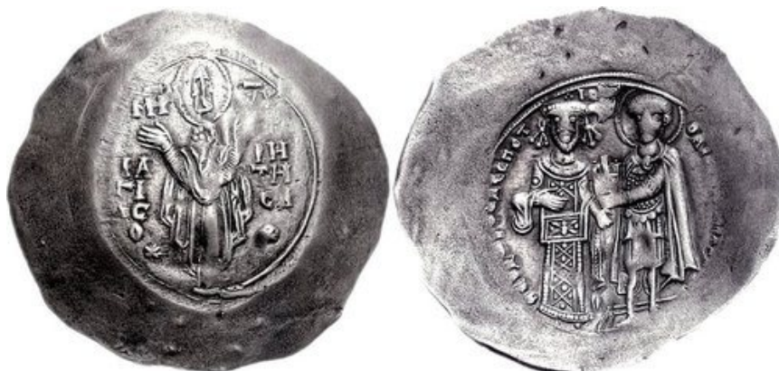
1. Njegov tast Teodor Komnenos Doukas (1215–1230).