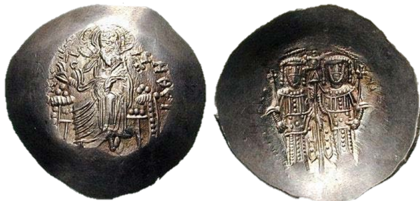
1. Njegov deda Alexios III Angelos Komnenos (1195–1203).