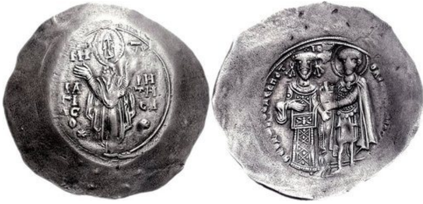
2. Njegov tast Teodor Komnenos Doukas Angelos (1215–1230).