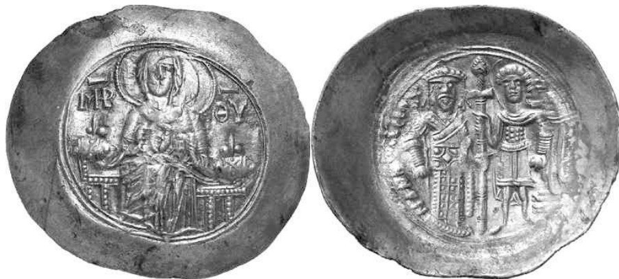
3. Njegov teča Manuel Komnenos Doukas Angelos (1230-1237).