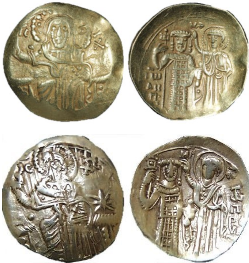
5. Muž njegove sestre ot tetke John III Doukas Vatatzes, sa visokim prestolom u pozadini na aversu (1222-1254).

Vrsta 5. 9 bakrenih "Isus blagosilja kralja" vrsta, kovanica broj 11 sa Grčkim slovima CTEΦANOC PIZ, Grčkim slovom Theta Θ i ΔYKAC potpis na levoj strani i OΠANTOKPATOY na desnoj strani sa razlikom na kovanicama broj 10 i 14, koje imaju ΔYKA potpis bez C I odvojeno P na reversu. Kralj drži globus I nosi kaiš sa 5 tačaka (ne 6 – kao vrsta 2) I dugačku nošnju sa jednom linijom tačaka u sredini sa Isusom koji drži knjigu Evanđela I nosi dugačku nošnju. Arhangel sa raširenim krilima drži mač I svitak sa Grčkim inicijalima: MH(XAHΛ) AP(XAΓEΛOY) što znači "Mihailo Arhangel" što je Isusovo ime I titula, na aversu. (Kovanice broj: 10, 11, 14, 28 I 37-41).