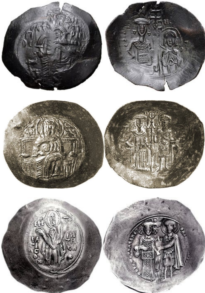
2. Njegov tast Teodor Komnenos Doukas Angelos (1215–1230).