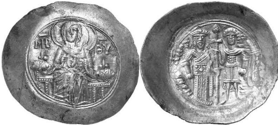
3. Njegov teča Manuel Komnenos Doukas Angelos (1230-1237).