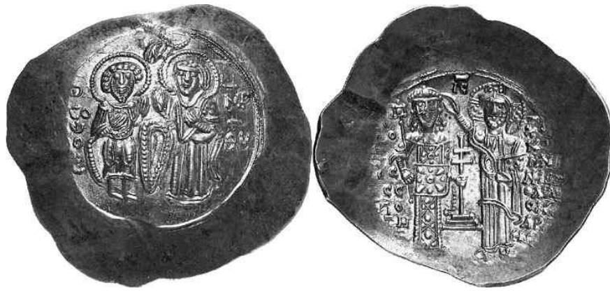
4. Njegov teča Theodore I Laskaris, bez visokog prestola u pozadini na aversu (1204-1222).